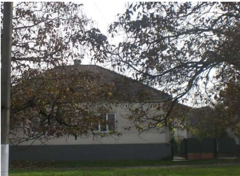
Czáró Fogarassy Hella utolsó lakhelye, régi zsidóház