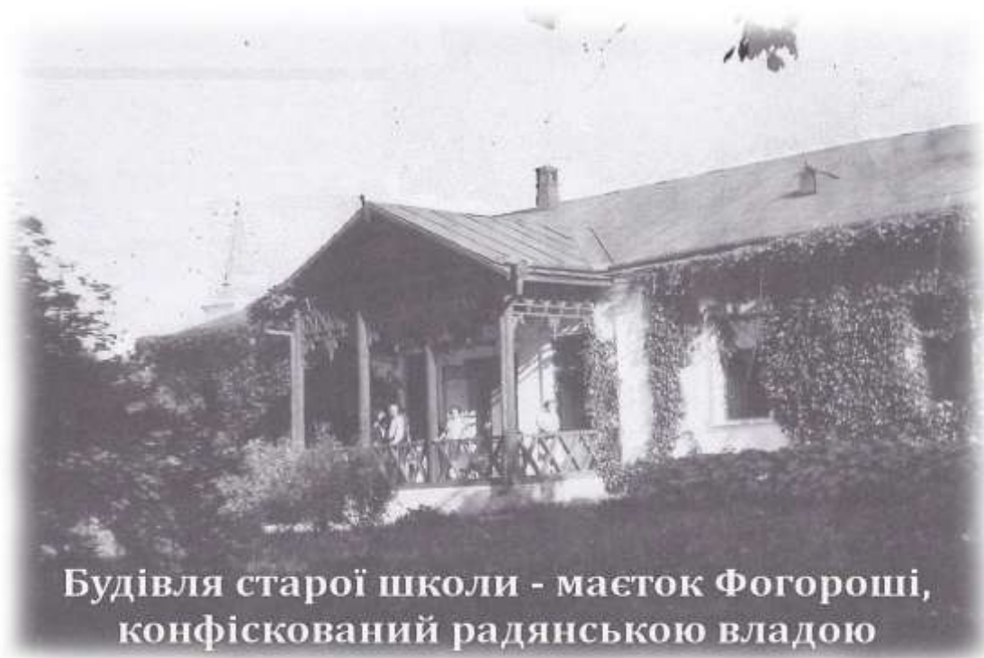
A Czáró Fogarassy kúri anno