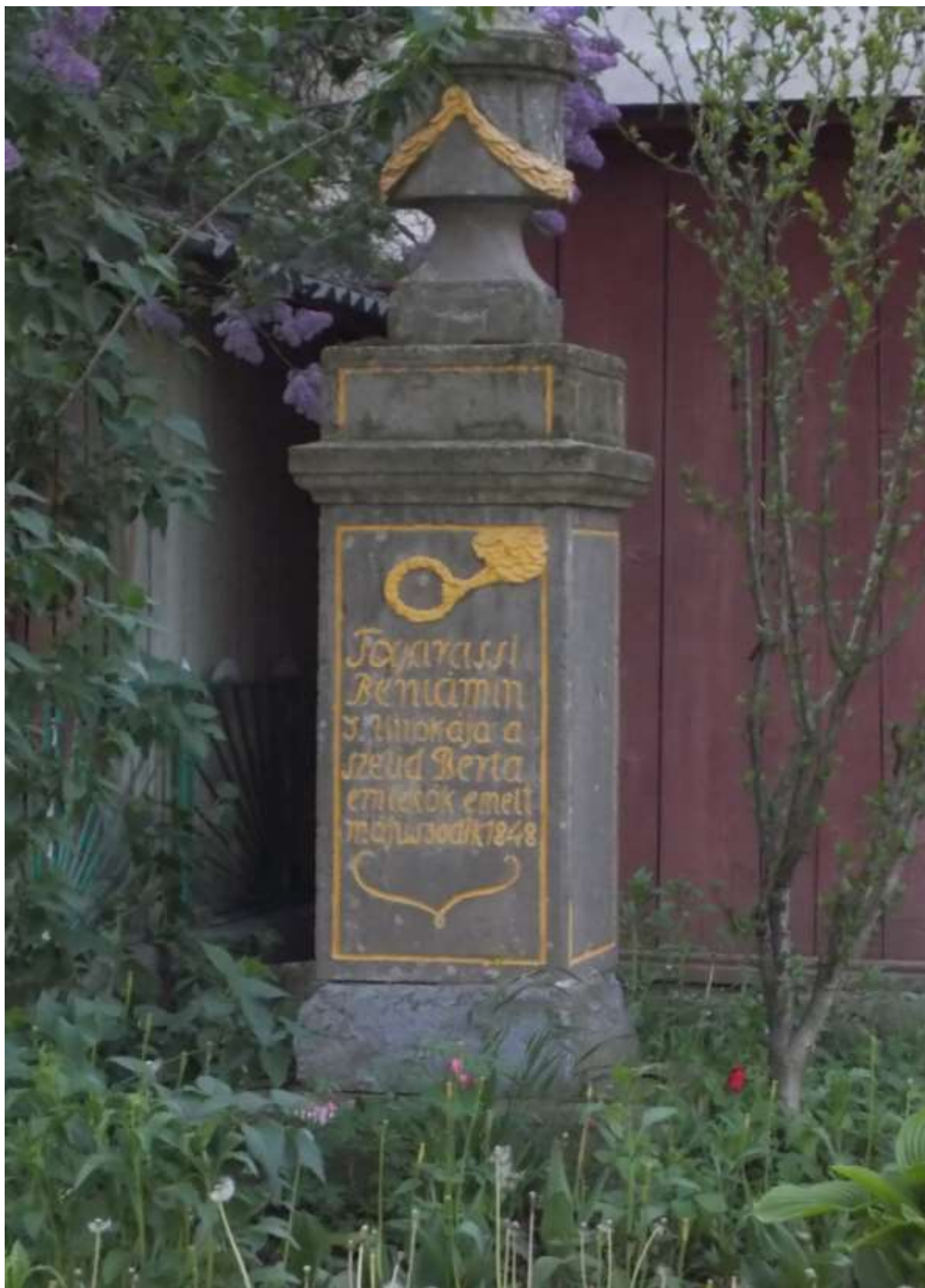
A református templom kertében található Fogarassy emlékmű (Fotó: Kalanics Éva, 2015)