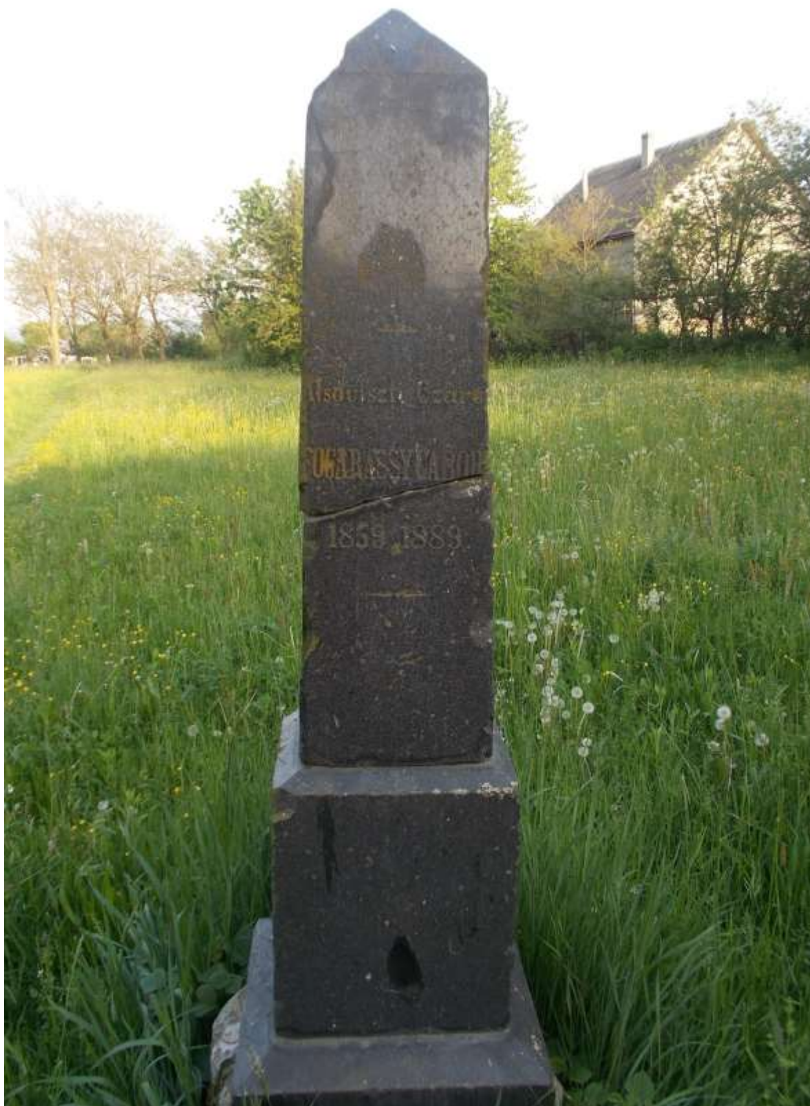
Alsóviszti Czáró Fogarssy Gábor emlékműve a csepei református temetőben