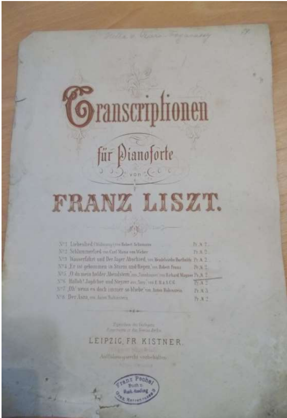
Czáró Fogarassy Hella egykori kottája a 2001-es Kárpátaljai árvíz után – jelenleg magántulajdonban van (Fotó: Kalanics Éva, 2016)