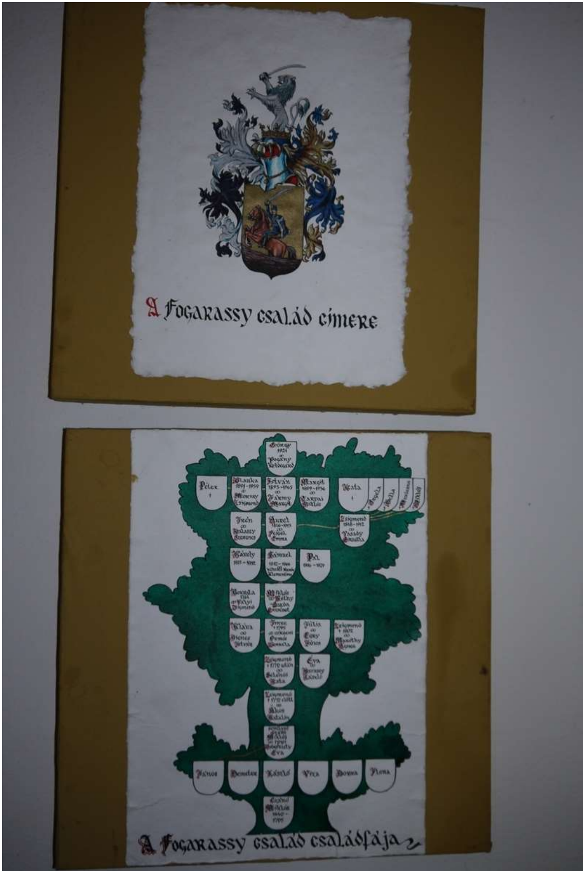
Tiszaháti Tájházi Múzeum (egykori Fogarassy- kastély) falán található Fogarassy család címere és családfája, Tiszafarkasfalva (Fotó: Espán Margaréta, 2015)