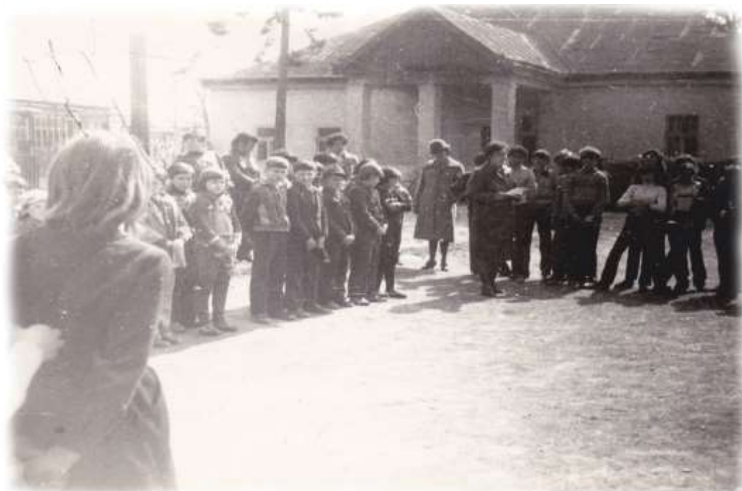
A kúria egyik gazdasági épülete, mint iskola