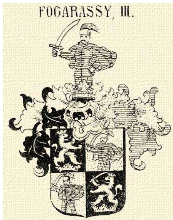
Fogarassy család címer változatai