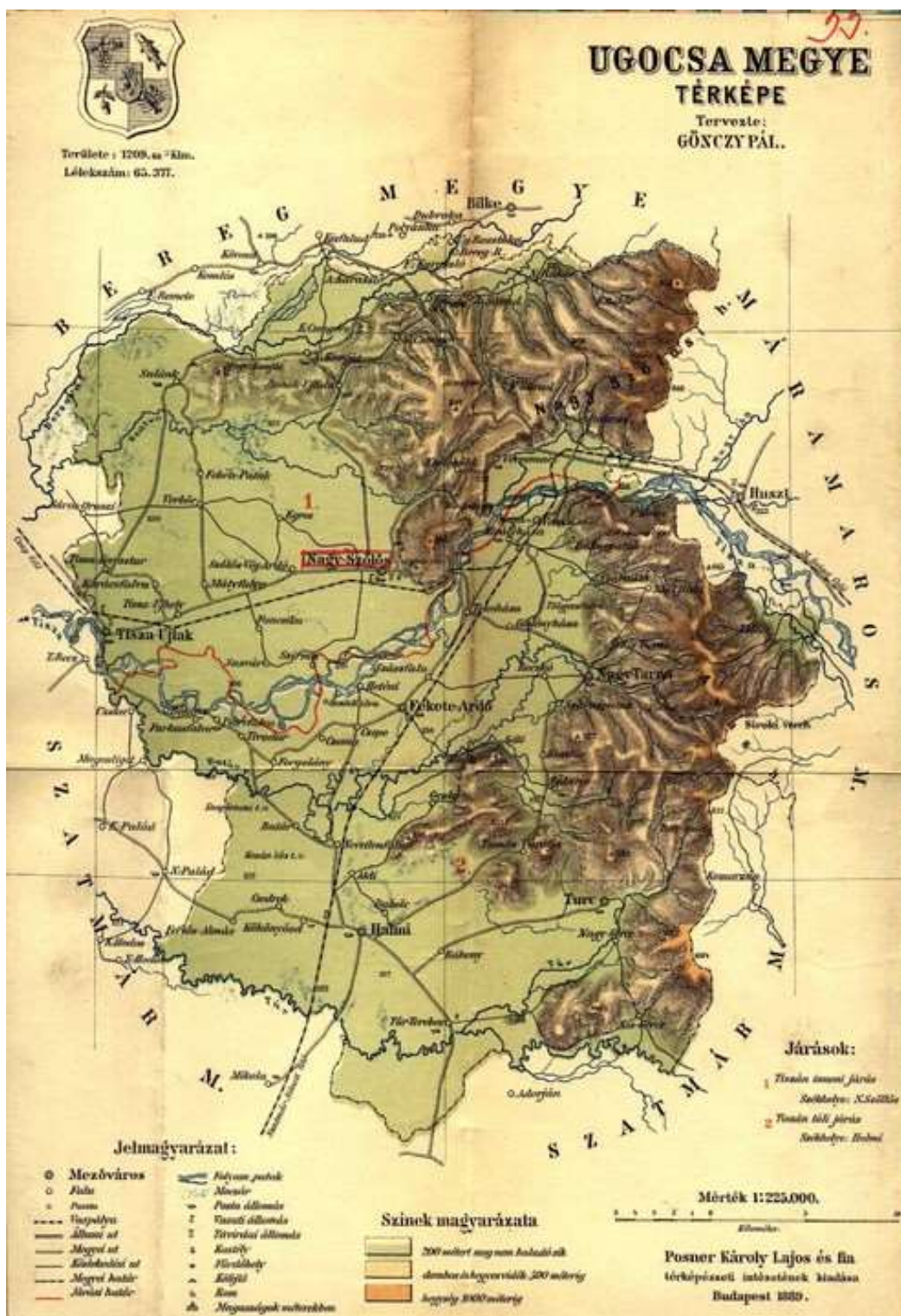
Ugočsa vármegye térképe