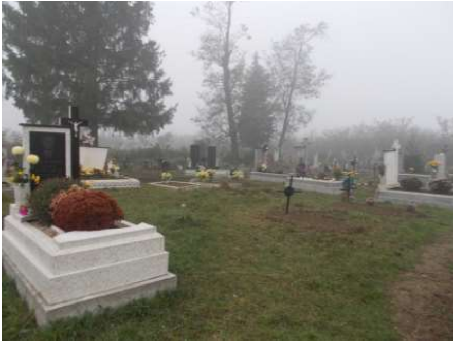
A fenyők, amelyek Czáró Fogarassy Angéla és Czáró Fogarassy Hella nyughelyét jelölik a csepei görögkatolikus temetőben a helyi lakosok visszaemlékezései alapján