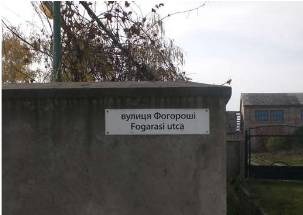
Csepei utcanévtábla