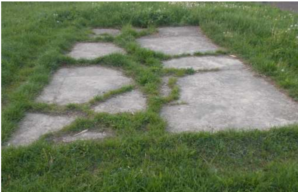
Czáró Fogarassy család kriptájának a lejárata, az iskola udvaron