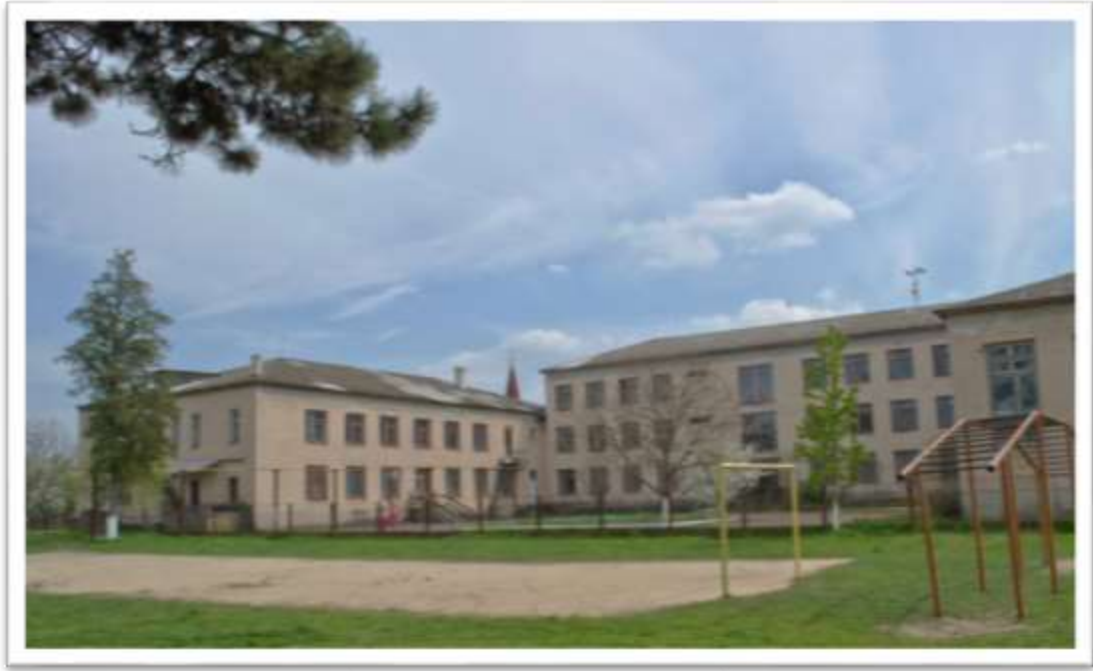
A Csepei Középiskola jelenlegi épülete, mely az egykori kúria helyén épült.