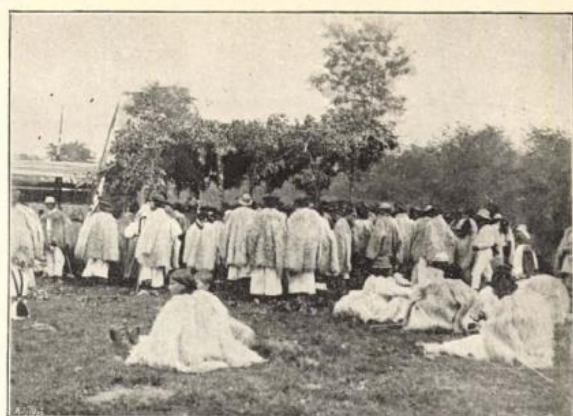
Háthegységi ruthének az ebéd kiosztásánál.