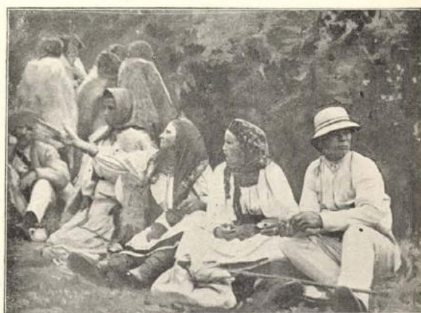
Tökési ruthének a közös ebédnél.