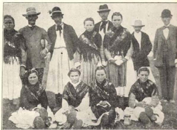
Felső-vecsekői ruthének a szolyvai járásból.

A MUNKÁCSI EZREDÉVI ÜNNEPÉLYRŐL. — Paur Géza pillanatnyi felvételei.