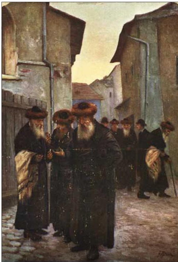
1. ábra. Haszid zsidók 133