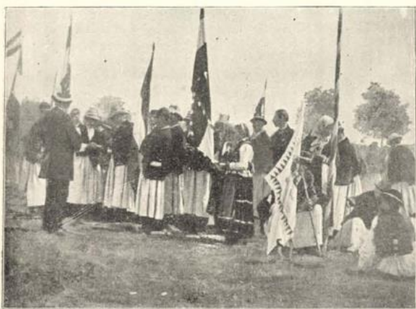
Kászonyi magyarok a tiszaháti járásból.